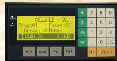
L'automate Arcos Compact